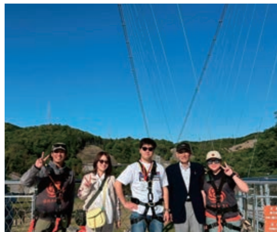
5月第二例会 安威川ダム見学例会