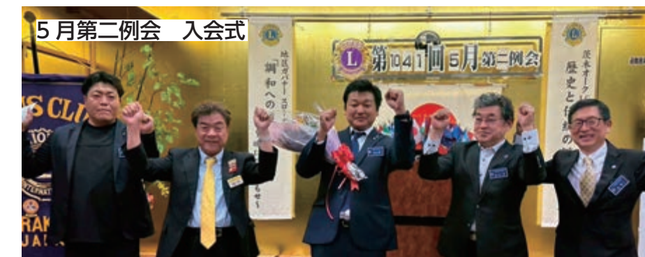
5月第二例会 入会式