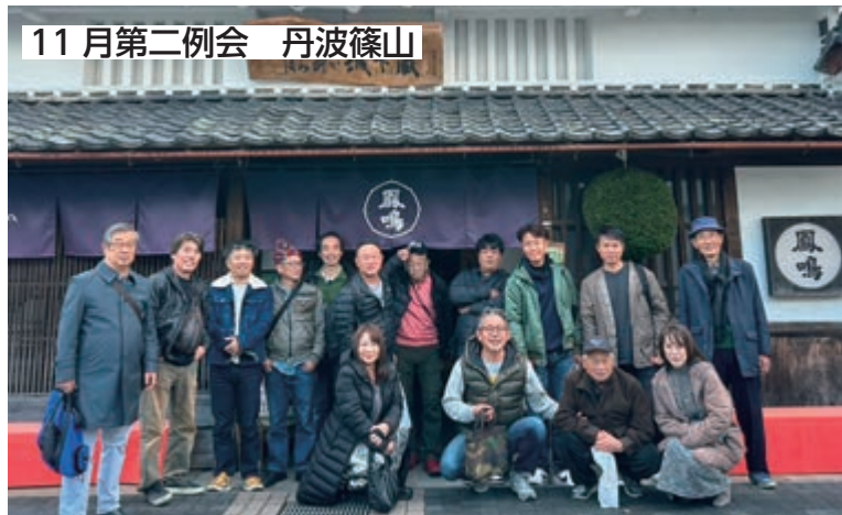
11月第二例会 丹波篠山