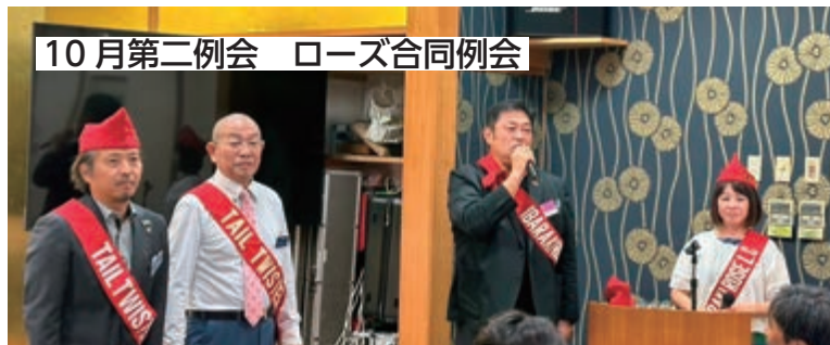
10月第二例会 ローズ合同例会