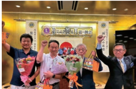
6月第二例会 最終例会