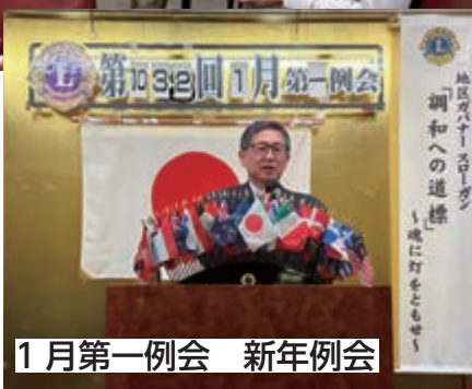
1月第一例会 新年例会