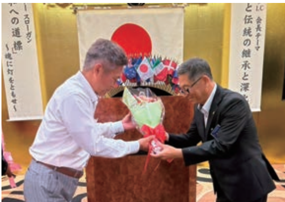
8月第一例会 入会式